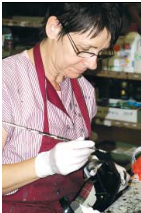
Stade ultime de la finition manuelle.