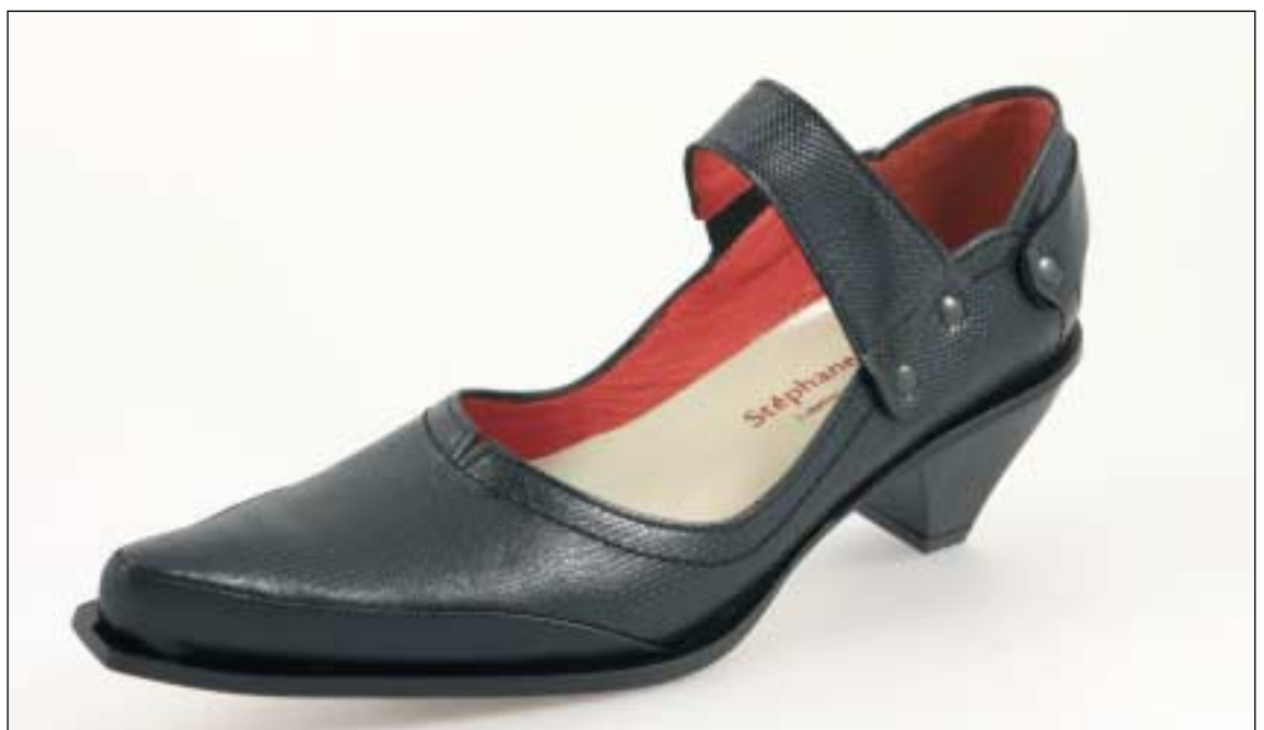
Le résultat de soixante-dix opérations différentes.