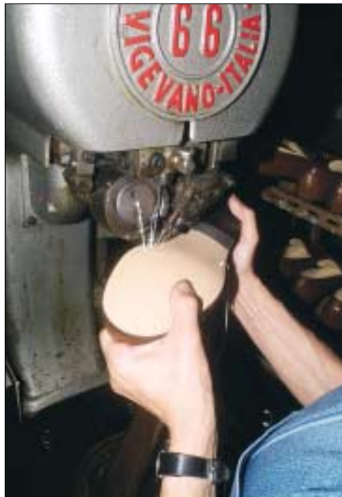
Les semelles sont cousues selon la technique appelée "couture Blake".