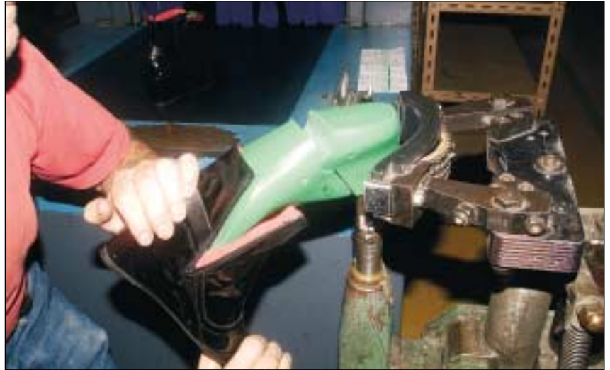
Action de séparation de la bottine de sa forme.