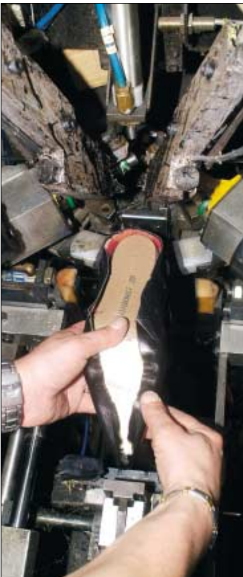
Machine à sécher et à réactiver la colle.