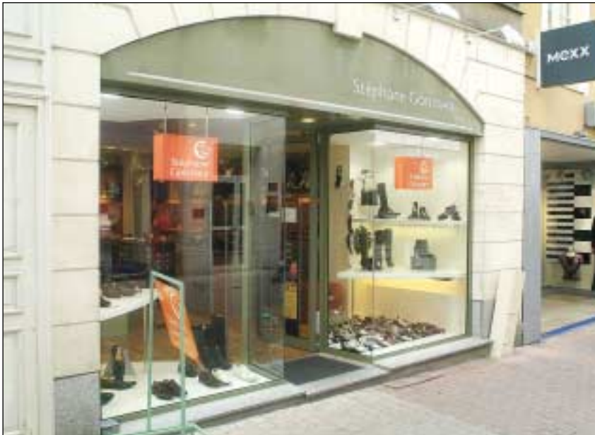
L'un des 11 magasins de la marque situé 8, rue Marchande au Mans.