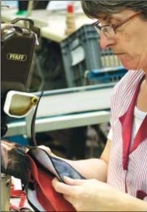
Assemblage par piquage.